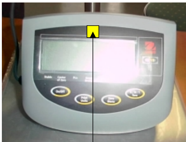
Ovjerni žig u obliku naljepnice